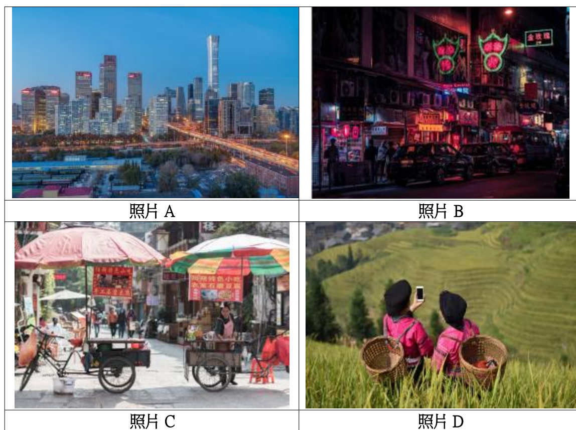
图 8.1 城市生活与农村生活的例子